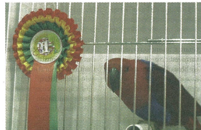
PAPAGAIO ELECTUS recebeu medalha de ouro

■ Pelo terceiro ano consecutivo, o Clube Ornitológico de Tondela arrecada medalhas de ouro no Campeonato do Mundo de Ornitologia.